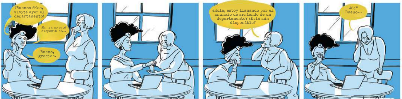
Historieta realizada por Dimani Mathieu Cassendo © Comisión de los derechos de la persona y derechos de la juventud

Suele suceder que propietarios actúen de forma discriminatoria hacia potenciales arrendatarios/as, impidiendo por ejemplo que visiten su departamento personas con un nombre que evoque orígenes étnicos árabe, africano o latinoamericano o que cuando una persona racializada se presenta para una visita, para negar el arriendo, fingen que el departamento ya ha sido alquilado.